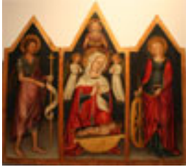
Vergine adorante il Bambino, l'Eterno, S. Giovanni Battista, S. Caterina d'Alessandria Maestro di Staffolo Tardo Gotico XV sec.

Le opere del Maestro di Staffolo, di Antonio da Fabriano, di Bicci di Lorenzo, del figlio Neri, del perugino