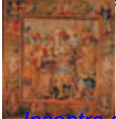
Incontro di Alessandro e Rossana Manifattura fiamminga, Rinascimento XVI sec.,