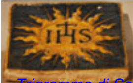
Triorama di San Bernardino da Siena Artigianato del XVI sec., Rinascimento XVI sec.,