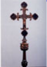
Croce processionale Arte italiana del XVI sec. , Rinascimento XVI sec.,