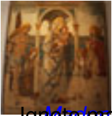
Madonna col Bambino , Bernardino di Mariotto , Rinascimento XV sec., Terza Sala