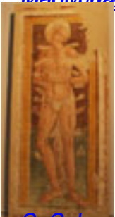
S. Sebastiano , Ignoto marchigiano , Rinascimento XV sec., Terza Sala