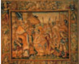
Alessandro il vincitore Manifattura fiamminga , Rinascimento XVI sec.,