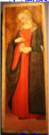
S. Annese , Ignoto marchigiano , Rinascimento XV sec., Terza Sala