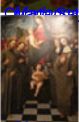
Madonna del Sacol Bambino, S. Francesco, S. Ludovico da Tolosa, S. Rosa da Viterbo, S. Rosa