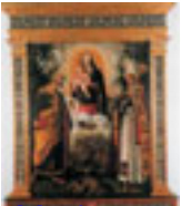
Madonna del Bambino Riscaldato XV sec. Quarta Sala