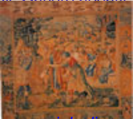
I senari degli apostoli gettano i libri eretici nel fuoco Manifattura fiamminga, Rinascimento XVI sec.,