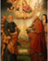
Madonna del Sacol Bambino, S. Nicola da Bari, S. Chiara, S. Pietro, S. Francesco Ignoto marchigiano