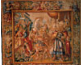
Alessandro donna Bucefalo Manifattura fiamminga, Rinascimento XVII sec.,