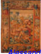
Alessandro abbatte Clito Manifattura fiamminga, Rinascimento XVII sec.,