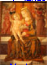
Madonna col Bambino , Bernardino di Mariotto , Rinascimento XV sec., Terza Sala