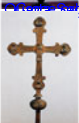
Croce processionale 1560 Arte italiana del XVI sec, Rinascimento XVI sec. Quarta Sala