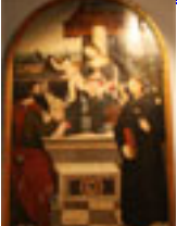
Madonna del Sacol Bambino, S. Paolo, S. Nicola da Tolentino Ignoto marchigiano (Identificato), Rinascimento X