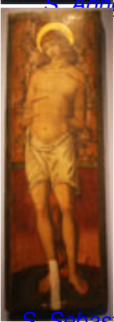
S. Sebastiano , Ignoto marchigiano , Rinascimento XV sec., Terza Sala