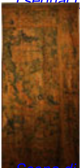
Scena di caccia Manifattura fiamminga, Rinascimento XVI sec.,