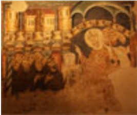
S. Agostino consegna la regola agli eremiti Maestro di S. Agostino , Romanico Bizantino XIII sec. Prima Sala