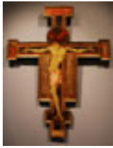
Croce dipinta Rainaldetto di Ranuccio da Spoleto , Romanico XIII sec., Prima Sala

Il termine "Romanico" è introdotto dagli studiosi medievalisti francesi degli inizi del XIX secolo per de