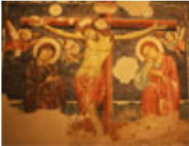
Crocefissione Maestro di S. Agostino , Romanico Bizantino XII sec , Prima Sala