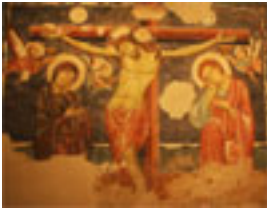
Crocifissione Maestro di S. Agostino, Romanico Bizantino XIII sec. , Prima Sala

Pittore attivo nella seconda metà del XIII secolo. È l'autore di tre affreschi provenienti dal convento d