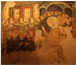
S. Agostino consegna la regola agli Eremiti Maestro di S. Agostino, Romanico Bizantino XIII sec. , Prima Sala